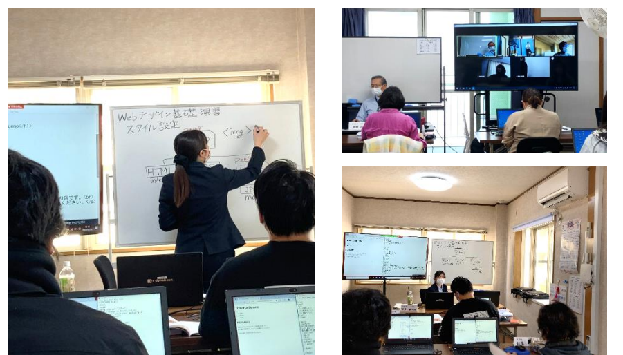
☆.:* ☆.:* パソコン訓練風景 ☆.:* ☆.:*