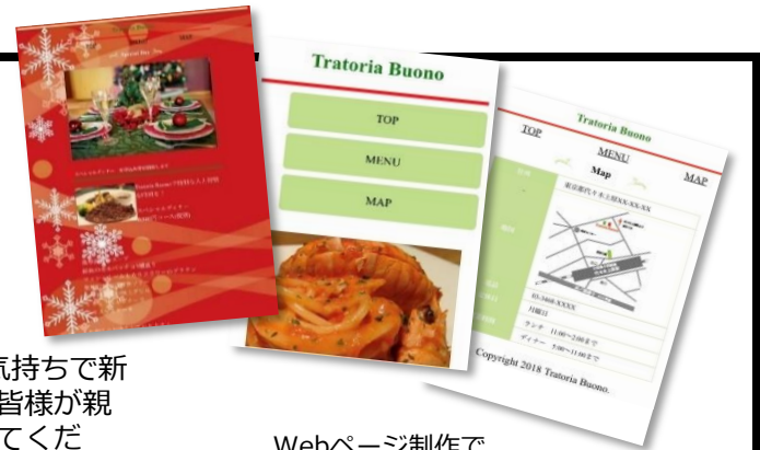
Webページ制作で 実際に作成した作品

毎日そちらに通学した3か月間は久々に学生に戻った気持ちで新鮮な時間を過ごすことができました。これもスタッフ皆様が親切に相談にのってくださったり、私たちの後押しをしてくださったおかげで新しい仕事に就くことができます。まずは一歩進めたことに安心しております。また顔を見せに寄せて頂きたいです。